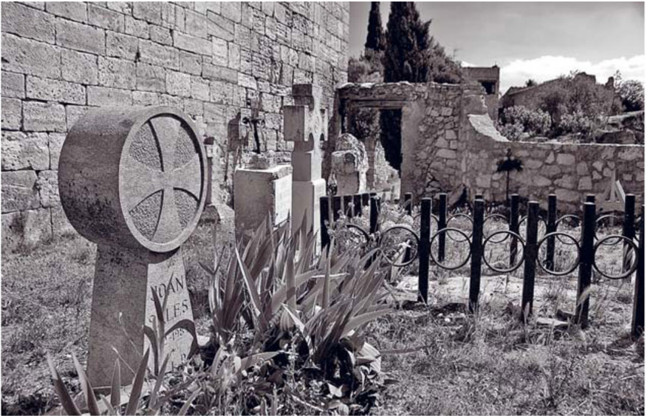
Tomba de Joan Sales a Siurana.