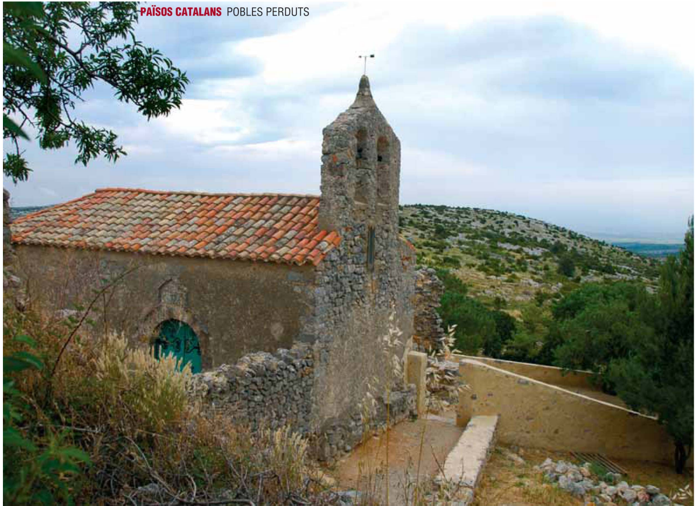
Església de Sant Miquel de Perellós (Rosselló). A baix, el dibuix que acompanya el text de Perellós.

torn d'estrets carrerons de terra, fràgils parets i aigües residuals. Però, tot i les condicions d'insalubritat, el barri disposava d'equipaments: l'escola del Castell (portada pel pare Botey), l'escola nacional Manuel de Falla (que pràcticament substituiria l'anterior), una guarderia (Los Ángeles), un dispensari, alguns comerços, sis safareigs públics, sis fonts i un centre social. No era una vida fàcil, però es treballava de ferm perquè fos digna.» L'any 1963 tenia a la ratlla de 3.500 habitants. El Camp de la Bota era una ciutat dins de la ciutat. Una ciutat de barraques en què els veïns convivien també amb les execucions sumaríssimes. «Hi