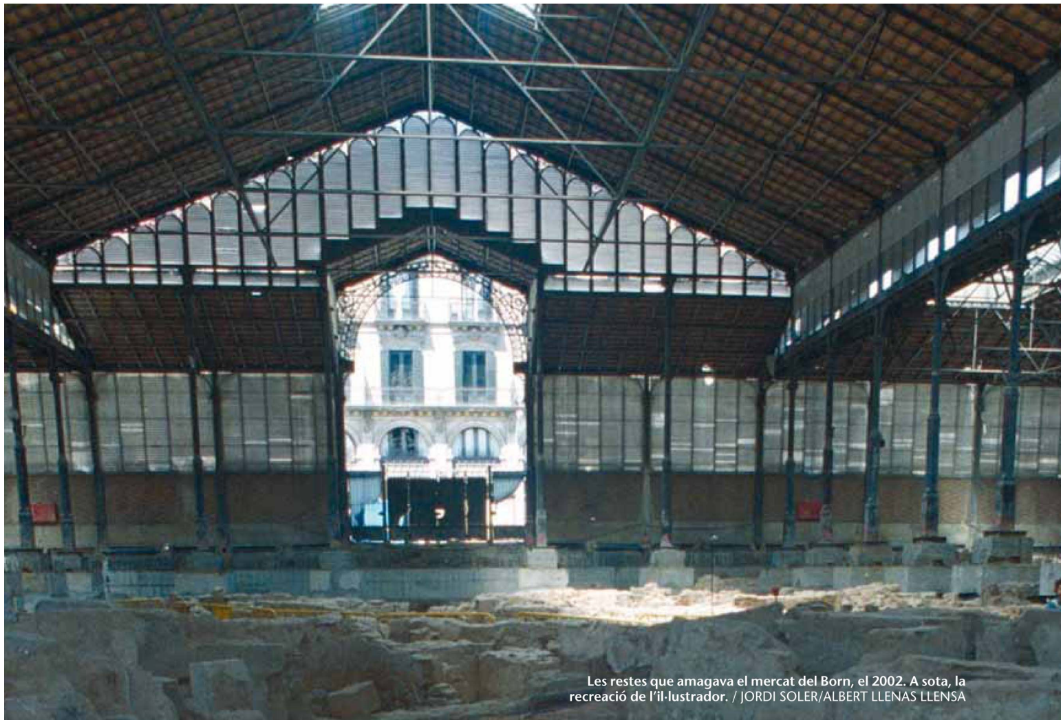
Les restes que amagava el mercat del Born, el 2002. A sota, la recreació de l'il·lustrador. / JORDI SOLER/ALBERT LLENAS LLENSA